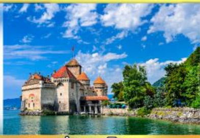
ปราสาทชิลยง