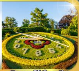
นาฬิกาดอกไม้เมืองจนีวา