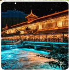
Blue Tears สะพานหนานเฉียว