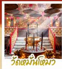
วัดเม้านไทมว