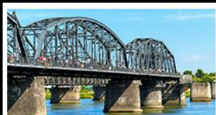
สะพานหวาดถานตง

2 มหัศจรรย์ธรรมชาติระดับโลก "หาดแดงผานฉิน" คู่กับ "ถ้ำน้ำเป็นสี" ยืนมองฝั่งเกาหลีเหนือที่ตามอง • ชมความยิ่งใหญ่ของพระราชวังเส้นหยางกู่กิง