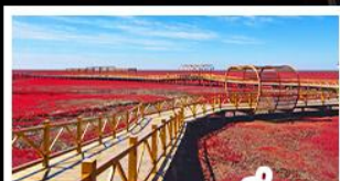
หาดแดงผานฉิน