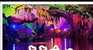
ถ้ำน้ำเป็นสี