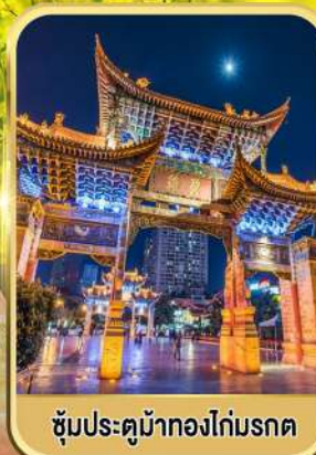
ซุ้มประตูม้าทองไถ่มรดก