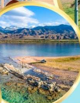
ล่องเรือทะเลสาบอิสซิค