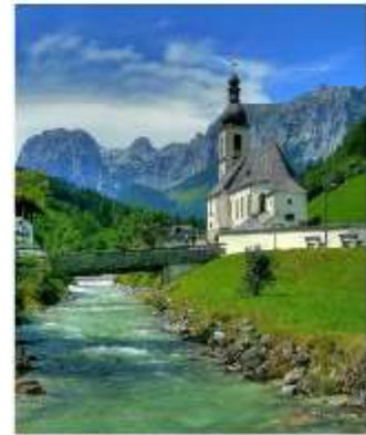
ออสเตรียบาวาเรียดินแดนแห่งเทพนิยาย

ออสเตรีย – บาวาเรีย (Austria-Bavaria) ดินแดนวัฒนธรรมเก่าแก่ที่ครอบคลุมสองประเทศและแทบแยกกันไม่ออกเลยที่เราเที่ยวอยู่ในออสเตรียหรือเยอรมัน ท่านจะประทับใจไปกับหมู่บ้านเล็กๆน่ารัก ที่ตั้งอยู่บริเวณริมทะเลสาบในเทือกเขา “เยอรมัน-ออสเตรียแอลป์” พร้อมบริการอาหารรสเลิศและที่พักอย่างดีระดับ 4 ดาว หลูหลูที่เราคัดสรรมาให้ท่านได้พักผ่อนอย่างเต็มที่ให้การเดินทางของทุกท่านคุ้มค่าที่สุดที่สุดในเส้นทางที่สวยงามที่สุดของออสเตรีย-บาวาเรีย