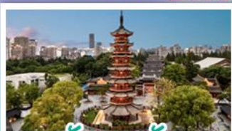
วัดเลงเฟ้ง