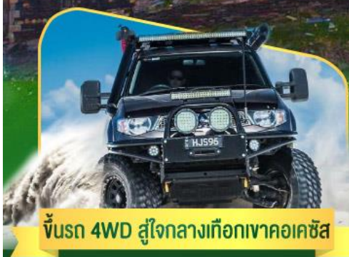
คันรถ 4WD สู้อีจกลางเทือกเขาคอเคซัส