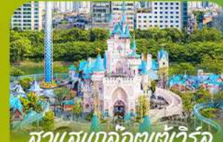
สวนสนุกลิตต์เวิร์ล Lotte Adventure World