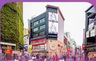
ช้อปปังจ่านเม็งงดง