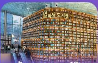
ห้างสมุดคชตาร์ฟลัก

เก็บทุกไฮไลท์ ในกรุงโซล ตั้งแต่ความงดงามของ พระราชวังเคียงบ็อก ชมวิวสุดอลังการที่ ตึกลิอิตเต้ โซลสกาย (รวมค่าลิฟต์ขึ้นตึก) สนุกสุดมันส์ที่ สวนสนุกลิอิตเต้ วิลล์ (รวมค่าบัตรเครื่องเล่น) เพลิดเพลินไปกับโลกใต้ทะเล สัตว์เต๋ อควาเรียม (รวมค่าบัตรเข้าชม) เช็กอินแสมค์มาร์กสุดฮิตอย่างห้องสมุดสตาร์ฟลา ไทเอกบอลส์ เดินเล่นย่านฮิป บริกฮัมเกาฮึ ของซุนง และช้อปปิ้งซัมเมอร์ซูล สุดฟิน ย่านเมืองคนและฮงแด