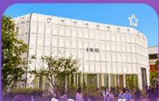
บริษัทคินเกาหลึ