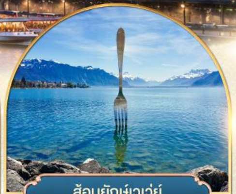
ส้อมยักษ์เวอเวย์