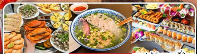
บุฟเฟ่ต์ซีฟู้ด