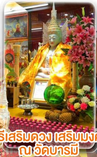
พิธีเสริมดวง เสริมมงคล ณ วัดบารมี

ได้เวลาอันสมควร ตามเวลานัดหมาย นำท่านเดินทางสู่ สนามบินเพื่อทำการเช็คอินเอกสารแก่ท่าน