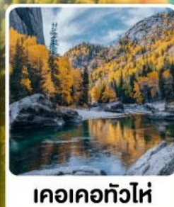
เคอเคอทัวไห้