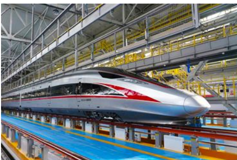
เบ็รถไฟความเร็วสูง