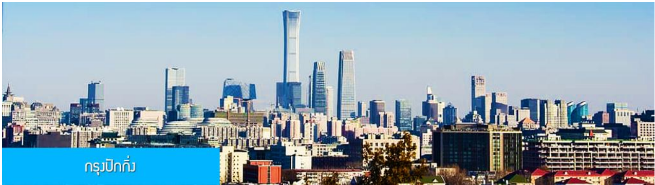
กรุงปักกิ่ง