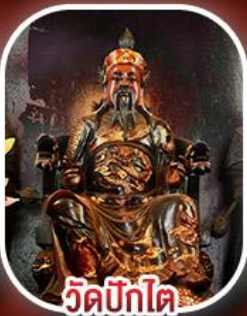
วัดปึกไต้