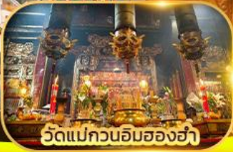
วัดแม่กวนอิมของฮ่า