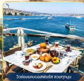
วิวช่องแคบบอสฟอรัส สวยทุกมุม