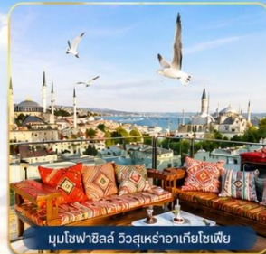
มุขโหลบฮิลล์ วิวสุเหร่าฮาเจียโซเฟีย

ช่องแคบบอสฟอรัส • สุเหร่าสีน้ำเงิน • สุเหร่าฮาเจียโซเฟีย