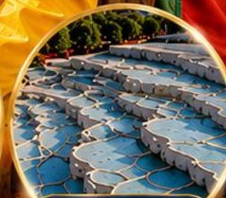
ปามุกคาล่า Pamukkale