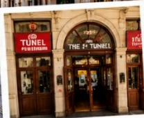
สถานีทูนเนล (TUNEL STATION) สถานีรถไฟใต้ดินสายเก่าแก่ และเป็นหนึ่งในระบบขนส่งที่เก่าแก่ที่สุดในโลก