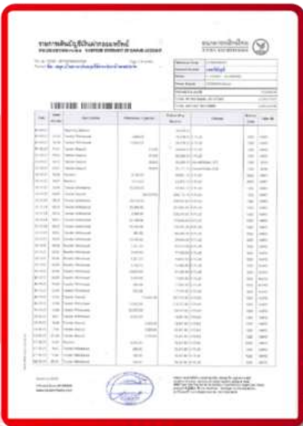
ตัวอย่าง Bank Guarantee ที่ผู้สมัครต้องยื่นธนาคาร