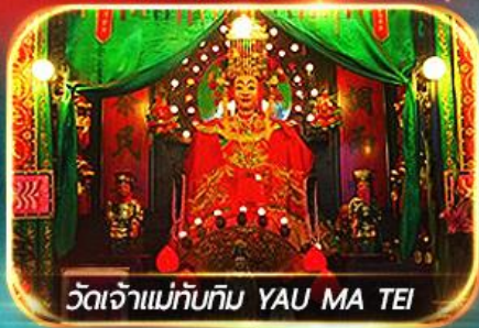
วัดเจ้าแม่ทับทิม YAU MA TEI