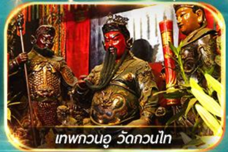
เทพกวนอู วัดกวนไท

พามุไหว้พระ: ขอรพร 8 วัดดัง, อิสระช้อปปิ้ง 1 วันเต็มแบบจุใจ