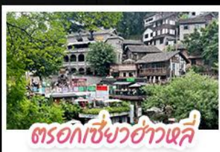
ตรอกเซี่ยวฮ่าวเฉี