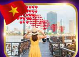
เช็किनสะพานแห่งความรัก