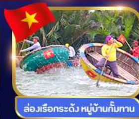
ล่องเรือกระดิว หมู่บ้านกิมทาน