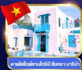
คาเฟ่สไตล์ซานโตรินี่ ชันทรา มารีน่า