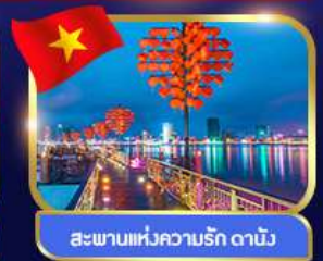
สะพานแห่งความรัก ดานัง