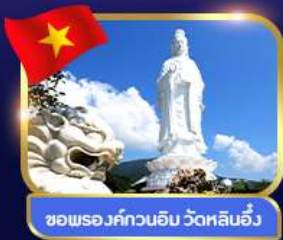
ขอพรองค์กวนอิม วัดหลินอึ้ง