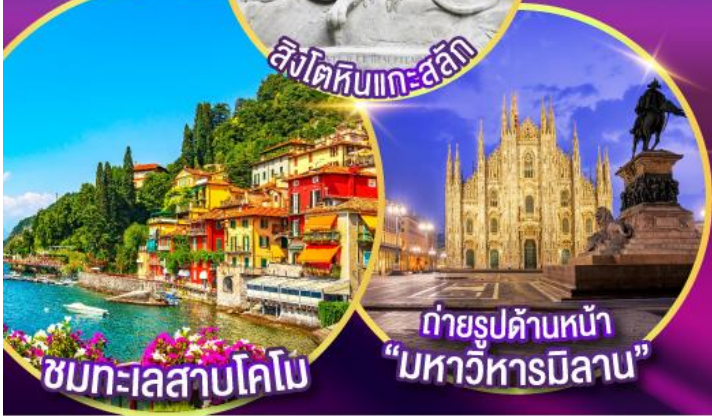
ชมทะเลสาบโคโม