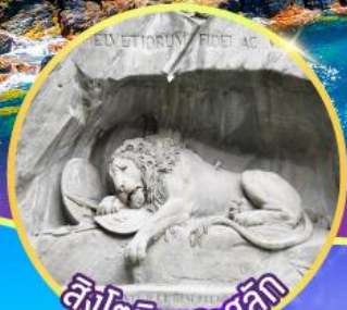
สิงโตหินทะเลสลัก