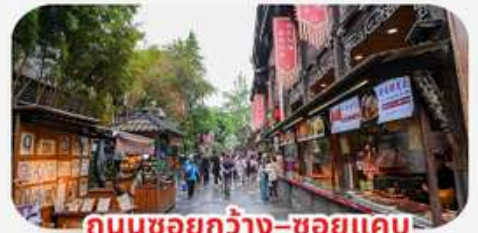
ถนนชอยกว้าง-ชอยแคบ