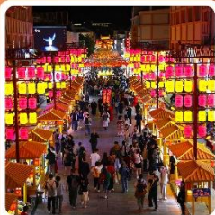
ตลาดกลางคีนซาโจว