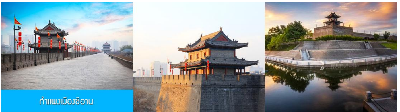
กำแพงเมืองซีอาน

หลังอาหารนำท่านนั่งรถบัสผ่านชม กำแพงเมืองโบราณ 西安古城墙 (เป็นการนั่งรถผ่านชมด้านนอก เนื่องจากค่าทัวร์ไม่ได้รวมค่าบัตรเข้าชมด้านใน ) กำแพงเมืองเก่าแก่ที่สร้างขึ้นในสมัยราชวงศ์หมิง อายุกว่า 600 ปี ตัวกำแพงมีฐานกว้าง 18 เมตร มีความสูง 12 เมตร ความยาวโดยรอบ 11.9 กิโลเมตร เป็นกำแพงเก่าแก่ที่ยังคงสภาพสมบูรณ์ที่สุดของจีน และเป็นโบราณสถานขึ้นชื่อของเมืองซีอาน