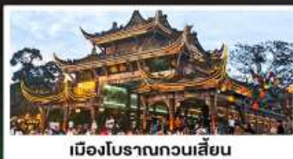
เมืองโบราณทวนเสียน