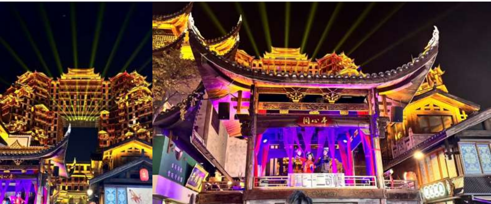
นำทุกท่านเข้าสู่ที่พัก VIENNA HOTEL ระดับ 4 ดาวท้องถิ่นหรือเทียบเท่า

นำท่านชม ตึกมหัศจรรย์ 72 แห่งเมืองจางเจี๋ยเจี๋ย ถูกสร้างขึ้นโดยนำเอาจุดเด่นของเมืองจางเจี๋ยเจี๋ยมารวมกัน โดยมีอาคารสูงที่สร้างจำลองถ้ำประตูสวรรค์ บ้านยกพื้นโบราณที่เป็นบ้านพื้นเมืองของชาวถู่เจี๋ย นอกจากนี้ที่นี่ยังถูกออกแบบให้กลายเป็นแหล่งรวมของ รีสอร์ท โฮมสเตย์ ร้านอาหาร แวงสตรีทฟู้ด ผับบาร์ ร้านขายของที่ระลึกมากมาย ** ชมด้านนอก**