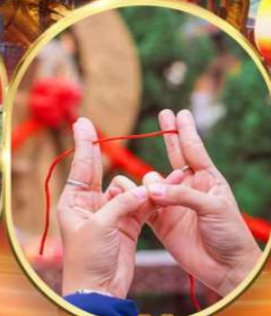
พิธีเทพเจ้าค้ายแดง