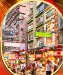
ช้อปปิ้ง ย่านจิมซาจุ้ย