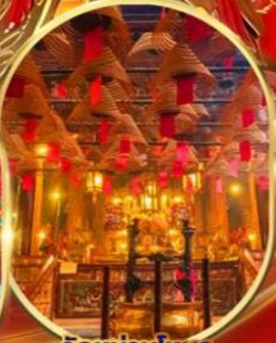
วัดม่านไหม