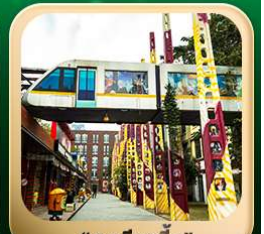
“ดงเจียวจื่อ”