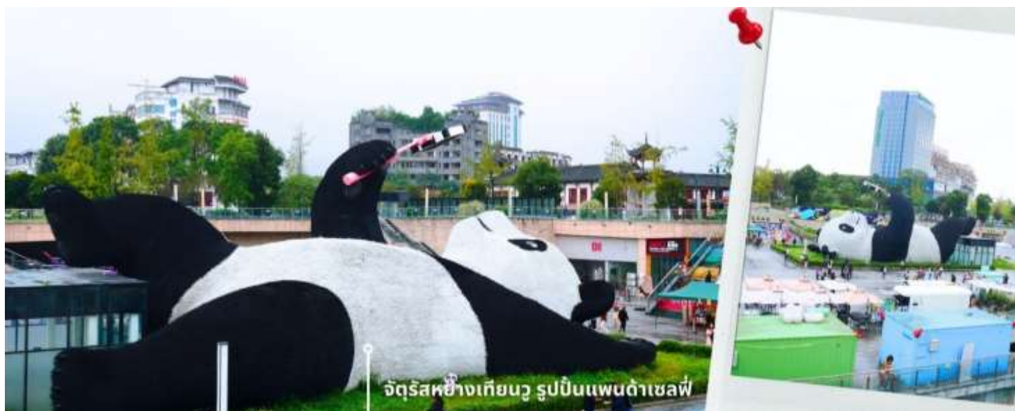
จัตุรัสหยางเทียนหวู่ รูปปั้นแพนด้าเซลฟ์

นำท่านเดินทางไปยัง จัตุรัสหยางเทียนหวู่ เป็นจุดเช็คอินที่สำคัญสำหรับคนที่มาเที่ยวที่ เมืองดูเจียงเยียน บริเวณจุดท่าข้าม อำเภอดูเจียงเยียน นครเฉิงตู ไฮไลท์ของจัตุรัสหยางเทียนหวู่ คือ ประติมากรรม แพนด้ายักษ์ที่กำลังนอนหงายท้องยื่นมือถือไม้เซลฟี่สีชมพู ซึ่งออกแบบโดยนักออกแบบชื่อดัง Florentijn Hofman รูปปั้นแพนด้า ยักษ์มีความยาว 26 เมตร กว้าง 11 เมตร สูง 12 เมตร และหนัก 130 ตัน แบบท่าทางสบายๆของแพนด้าที่ความประทับใจและรอยยิ้มให้กับผู้ที่มาเยือนจัตุรัสหยางเทียนหวู่ สามารถดึงดูดนักท่องเที่ยวได้เป็นจำนวนมากเลยทีเดียว เป็นการแสดงออกด้วยภาษาทางศิลปะแบบหนึ่งที่สะท้อนชีวิตในท้องถิ่น มอบความรู้สึกสนิทสนมและมีความสุขกับผู้ชม อิสระเดินชม