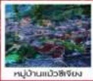
หมู่บ้านแม่วชิรัมย์