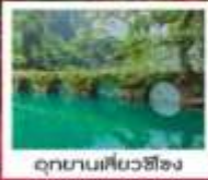
อุทยานเสี้ยวซือจง