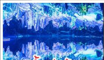
ถ้ำลุ่ม้อ