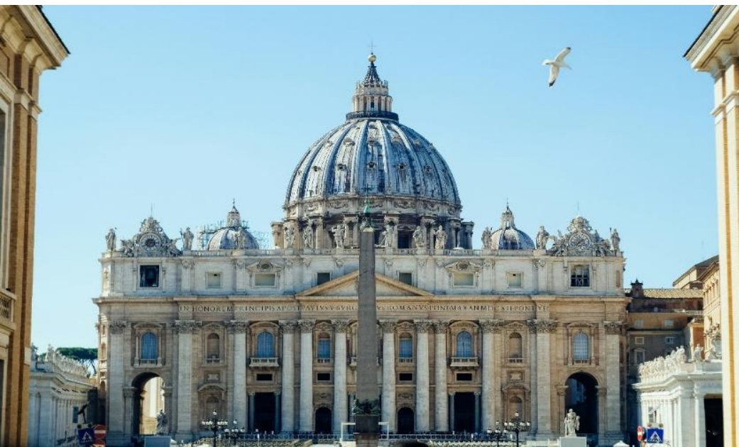
มหาวิหารนักบุญปีเตอร์ ( ST. PETER' BASILICA)

(กรณีมีพิธีด้านใน หรือถ้าหากมีผู้เข้าชมเป็นจำนวนมากจนไม่สามารถเข้าชมได้ทันเวลา ทั้งนี้เพื่อมิให้กระทบต่อกำหนดการท่องเที่ยวอื่นๆ ภายในโปรแกรมทัวร์" อาจจะไม่ได้รับการเข้าชม)