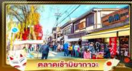
ตลาดซามิยากาวะ