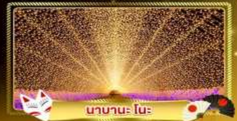
นานาะ โนะ