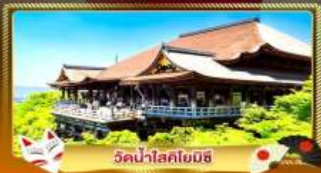
วัดน้ำสคยมิชิ