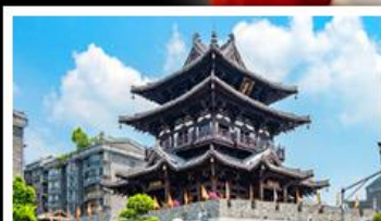
หอเขียวหยก