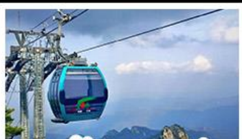
กระเช้าเขาเหยาซาบ