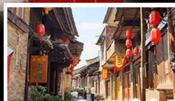
ถนนคนเดินตงซีเซียง