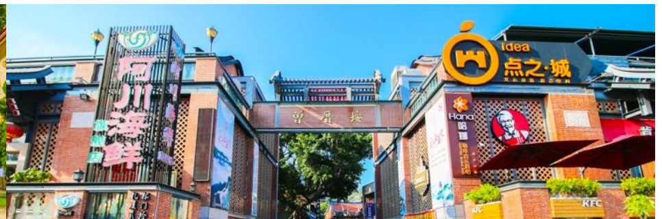
หมู่บ้านชาวประมง เจิงจ้าวอัน