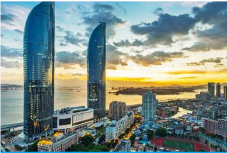
นครเซี่ยเหมิน