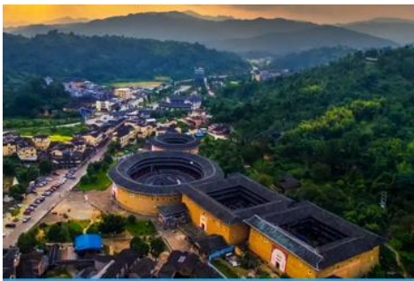
บ้านดินโบราณฉือโหลวกาเป่ย์

พักที่ โรงแรม HAKKA EARTH BUILDING PRINCE HOTEL 4* หรือเทียบเท่าในเมืองหย่งต้ง