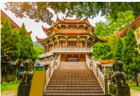
วัดหนานถ้าวชื่อ

พักที่ โรงแรม XIAMEN HENGLONG HOTEL 4* หรือเทียบเท่าในเมืองเซี่ยเหมิน