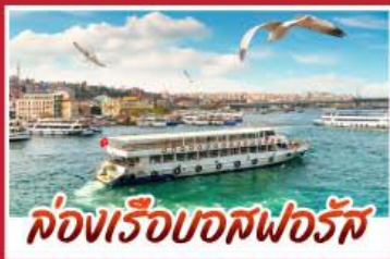
ล่องเรือบอสฟอรัส