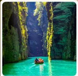
ผิงชานแกรนด์แคนยอน