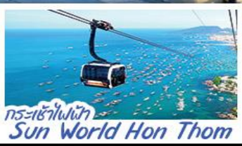
กระเช้าไฟฟ้า Sun World Hon Thom