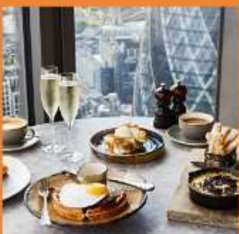
DUCK AND WAFFLE