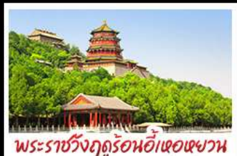
พระราชวังฤดูร้อนอ้าเฮอเฉวทวน

ท่าแพงเมืองจินด่านจวียงกวน - พระราชวังฤดูร้อนอ้าหอยวน สวนจิ่งอัน - วัดลามะ - ไม่ลงร้านช้อปปิ้ง - โรงแรม 4 ดาว มือพิเศษ เปิดปีกกึ่ง สุกิมองโกล MICHELIN GUIDE ร้าน TAO TAO JU