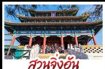
สวนจิ่งอัน