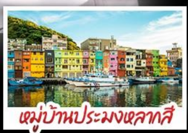
หมู่บ้านประมงเหลากสี