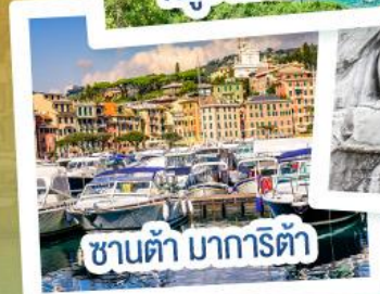
ซานต้า มารีตา