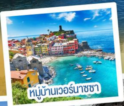
หมู่บ้านเวอร์นาชชา