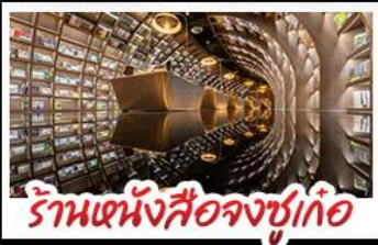
ร้านหนังสือจงซูเก๋อ

ภูเขาสี่ดรุณี - อุทยานปี้เฉิงโกว - รูปปั้นหมี่แพนด้า นอนเซลฟี ร้านหนังสือจงซูเก๋อ - วัดต้าฉือ - ถนนโบราณชอยกวางชอยแคบ เมบูพิศข สุกี้หมาล่าเสฉวน