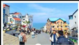
ถนนคอปเพิลิงหมายเลข 8

สัมผัสความยิ่งใหญ่ของ 4 เมืองสำคัญ ชิงเต่า - เยียนโก - เฟิงไห่ - เว่ยไห่ ปาต้ากวน - โบสถ์คาทอลิก - ตึกเก่าริมหา