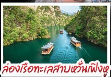
ล่องเรือทะเลสาบหวินเฟิงหู