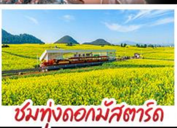
ชมทุ่งดอกมัสตาร์ด