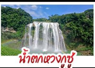
น้ำตกแขวงกู่ชู่