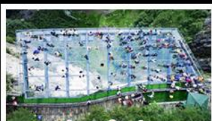
ระเบียงแก้วอยู่เฉย