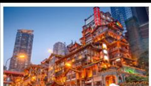
ตลาดแดงเซาตัง